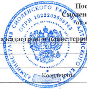
Схема расположения земельного участка на кадастровом плане территории