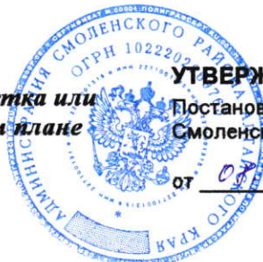
Схема расположения земельного участка или земельных участков на кадастровом плане территории 22:41:040601