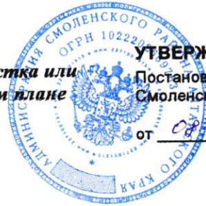
Схема расположения земельного участка или земельных участков на кадастровом плане территории 22:41:040601