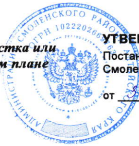
Схема расположения земельного участка или земельных участков на кадастровом плане территории 22:41:021223