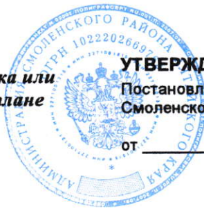
Схема расположения земельного участка или земельных участков на кадастровом плане территории 22:41:040601