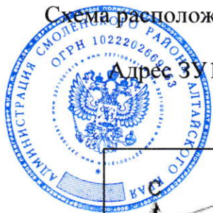
Схема расположения земельного участка на кадастровом плане территории (кадастровый квартал 22:41:040208)

Адрес ЗУ1: Алтайский край, район Смоленский, с. Солоновка, ул. Советская.