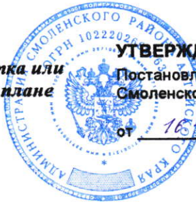
Схема расположения земельного участка или земельных участков на кадастровом плане территории 22:41:021225