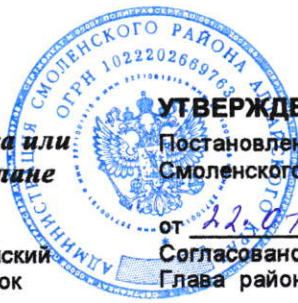
Схема расположения земельного участка или земельных участков на кадастровом плане территории 22:41:021235