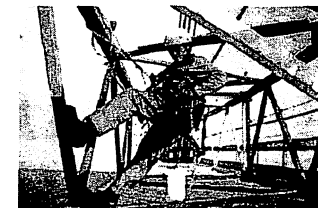
Монтаж и ремонт конструкций